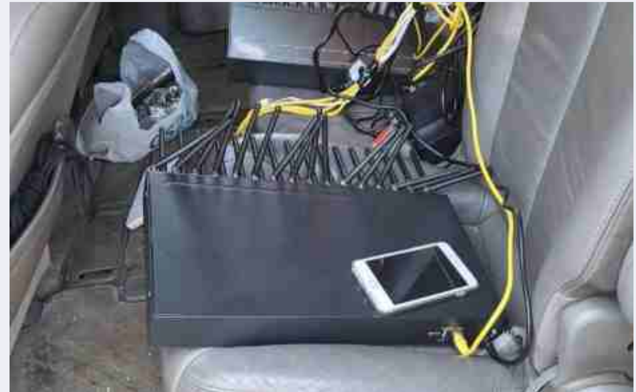
Phương thức bộ trung kế VoIP