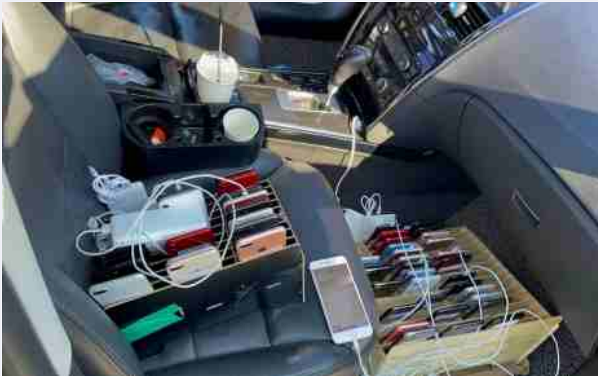
Phương thức ghép nối VPN

Giúp người khác truy cập VPN hoặc sử dụng bộ trung kế VoIP cũng là phạm pháp