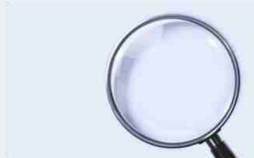
Luôn luôn chú ý