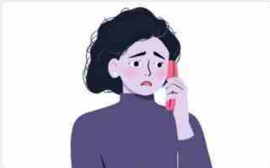
Yêu cầu tư vấn pháp lý